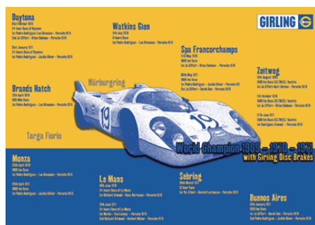
1969、1970、1971年においてGirlingブレーキを装着して勝利したレースのイメージヴィンテージポスター

Girling (ガーリング) は英国発のブレーキメーカーです。1930年代以降、自動車発展の歴史に先進の技術で輝かしい貢献をした日本でも非常に馴染みの深いメーカーです。Girlingの代表的な功績として、1950年代に世界初のディスクブレーキ実用化に成功しました(トライアンフTRシリーズに採用)。その後世界中にその技術のライセンス供給を行い、現代では世界の車四台に一台の割合で、Girlingの開発した技術が利用・応用されていると言われています。20世紀後半には買収元であるLucas社のLucasブランドに統一され市場から姿を消してしまいましたが、21世紀の今日、待望のGirlingブランドが日本に再上陸します。